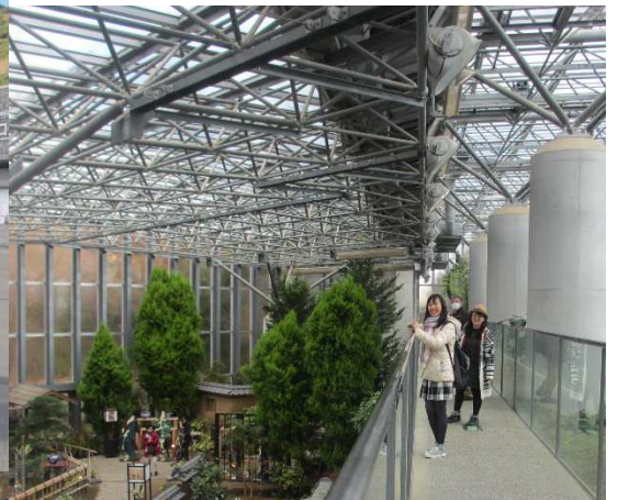
奇跡の星の植物館