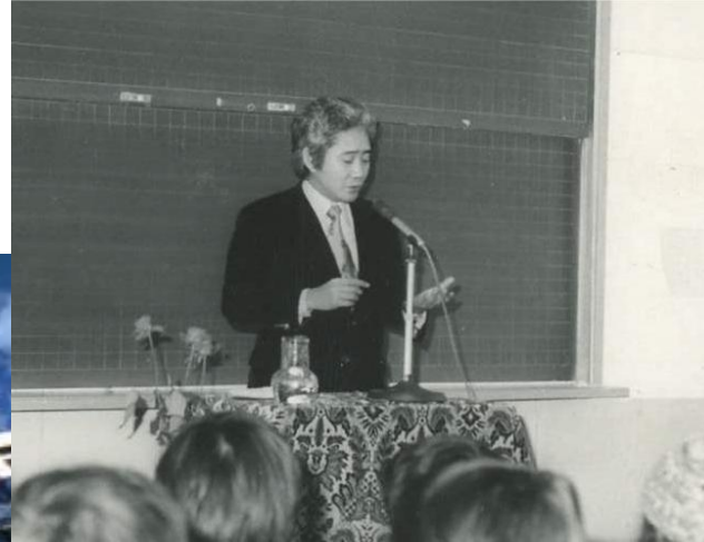
35年前、大教室での講演会(旧1号館141) (学生自治会主催)