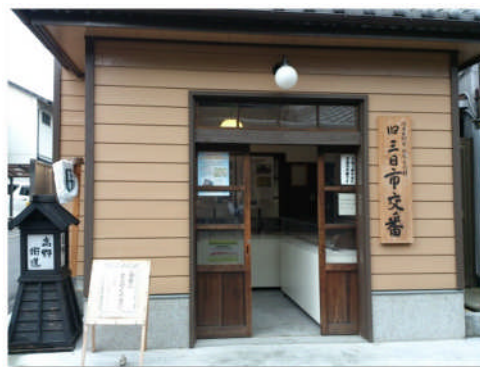
旧三日市交番 [市指定文化財]