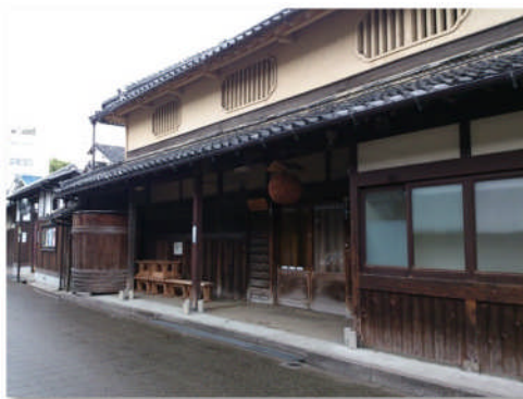
天野酒醸造元西條合資会社 [国登録有形文化財]