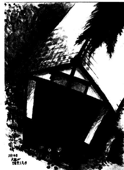
「大阪が焼失した日」