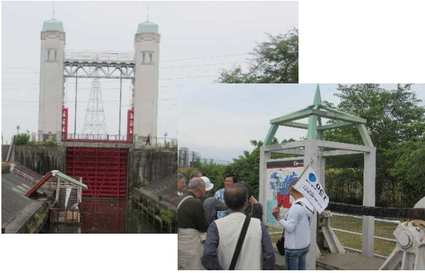
三栖閘門：パナマ運河と同じ構造形式