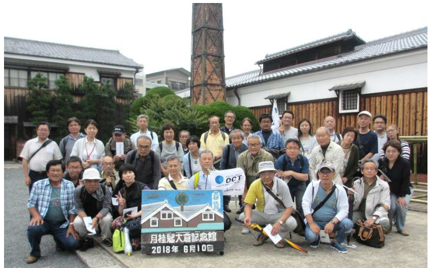
月桂冠大倉記念館 中庭