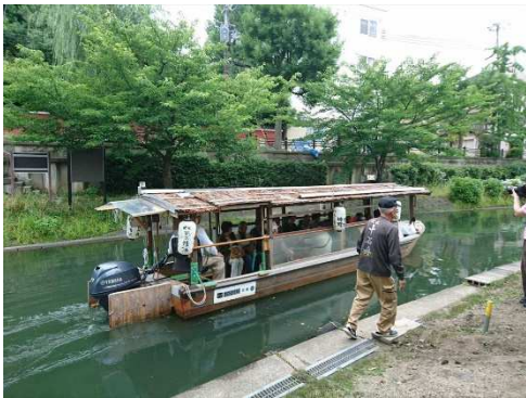
昔を偲びながらの十石舟遊覧