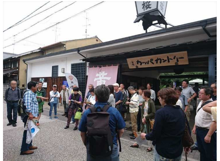
黄桜酒造（カッパカントリー）美味しい昼食