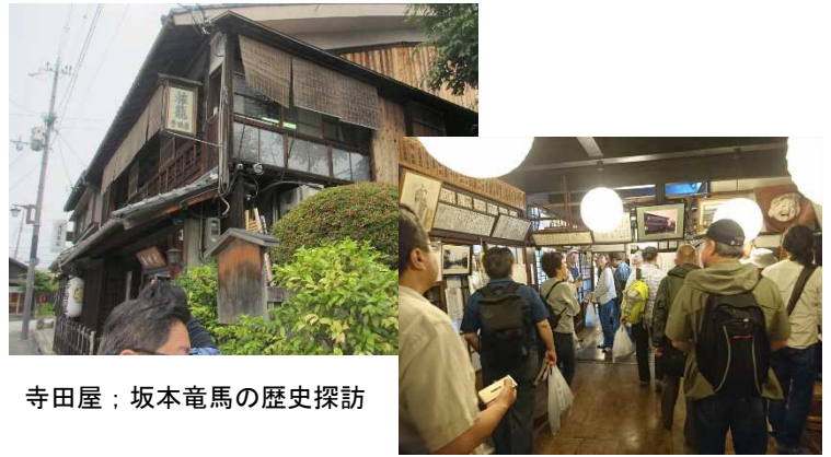
寺田屋；坂本竜馬の歴史探訪