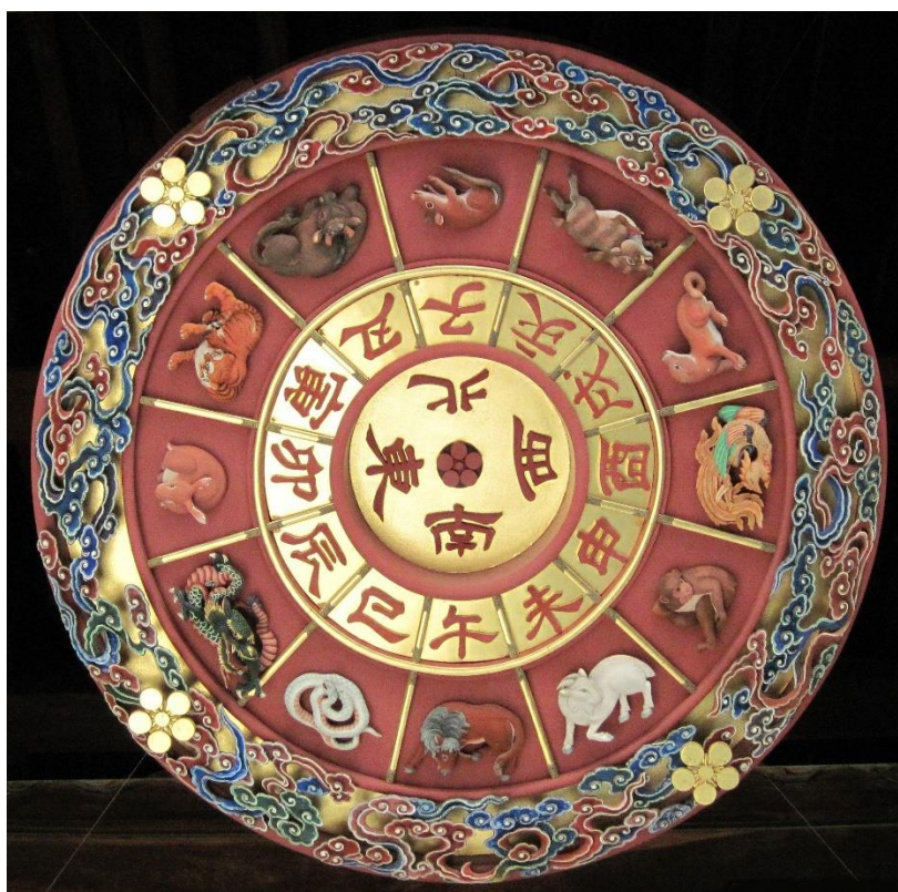
〈大阪天満宮〉。きっかけが崇りでも信仰される神様になれました。