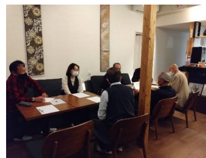
和気あいあいの中、真剣に来年の活動計画を話し合う