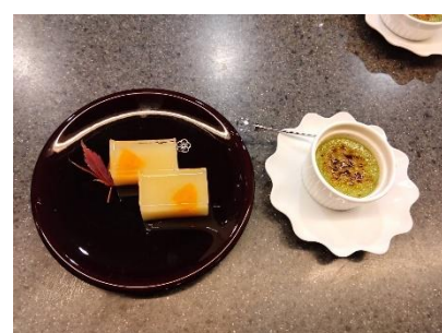
役員会後は、懇親会(クエ鍋や手作りデザートに舌鼓)