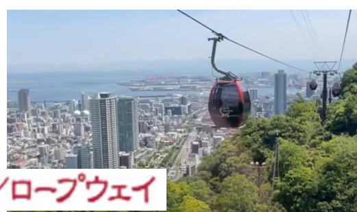
神戸布引ハーブ園/ロープウェイ