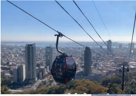
ロープウェイで山頂へ ↑