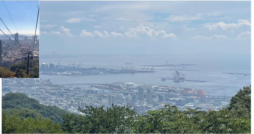
山頂の展望台より(左上:六甲アイランド)