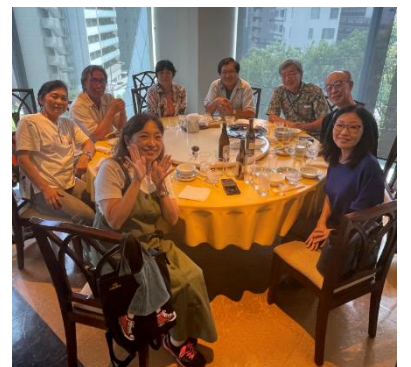
テーブル席でブリック顔