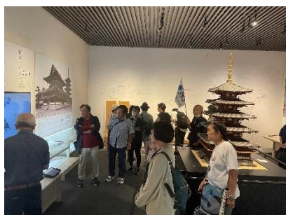
真剣に聞き入る参加者