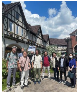
ちょっと小集合写真