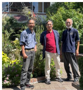
昭和47年卒の仲間集合