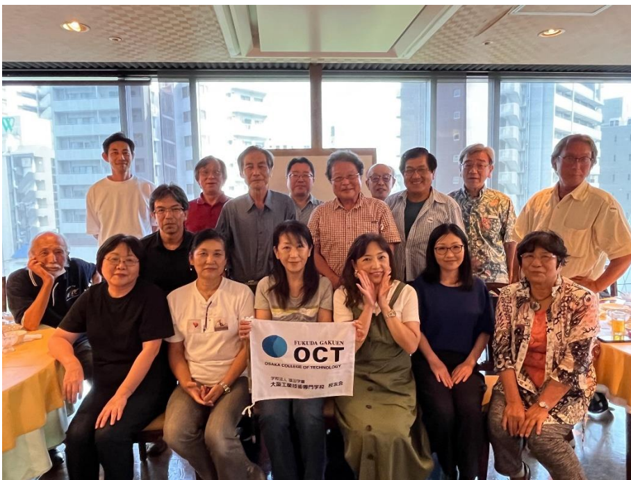
食後の集合写真(皆さんの満足顔)